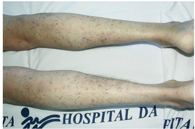
Fig. 2.—Pápulas violáceas puntiformes en extremidades inferiores.

La vitamina C se determina en el plasma o en los leucocitos. Los niveles séricos son específicos, pero no sensibles 80 . Varían con facilidad en función de la in-